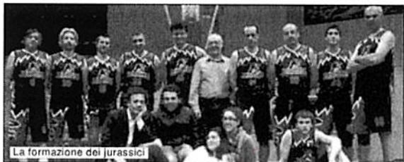
La formazione dei jurassici

Nella giornata di sabato santo avranno luogo le gare due di semifinale. Alle 19, al Palafrentinini di Ferrazzano ci sarà il confronto tra la Polisportiva Chaminade ed il Jurassic Team. Un'ora più tardi sul parquet del Palapedenontiana di Venafro il Basket Venafro cercherà di impattare i conti con l'Airino. L'eventuale gara tre è prevista il 29 ed il 30 aprile. Per le vincenti, poi, la finale a partire dal 7 maggio con per la vincente poi il confronto spareggio con la seconda del torneo abruzzese.